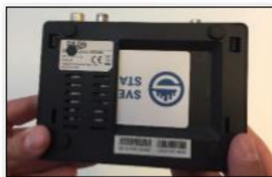
Ex. Programkort i extern digitalbox