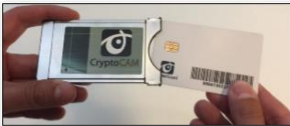
Ex. Programkort i CA-modul

Man följer instruktionerna i manualen för den digitalbox eller CA-modul man har eller som man köper. Där ser man hur man sätter i programkortet. Se också till att montera programkortet i digitalboxen eller CA-modulen på rätt sätt, så den fungerar som den ska.