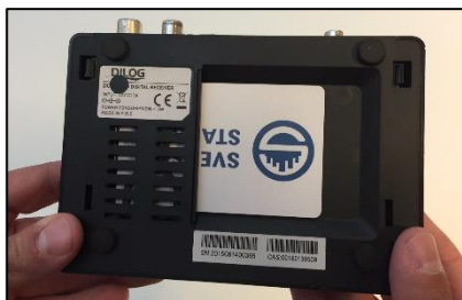
Ex: Programkort i extern digitalbox.