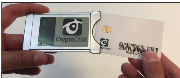
Ex: Programkort i CA-modul.