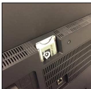
Ex: Inbyggd box i TVn. CA-modul och programkort monterat i TVn. Andra tv-apparater kan ha sin plats (CI, Common Interface) placerad på annat ställe.

Följ installationsmanualen för digitalboxen eller CA-modulen som du har eller som du köper. Där ser du hur du sätter i ditt programkort. Se också till att du monterar programkortet i digitalboxen eller CA-modulen på rätt sätt, så den fungerar som den ska. Programkortet sätts i platsen för kort och då kodas kanalerna av och du kan se dem som vanligt. Se i tv eller digitalboxens manual hur kortet ska sättas i.